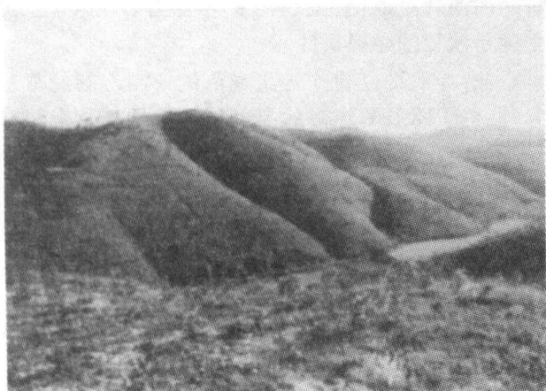
图1 亚热带退化草坡